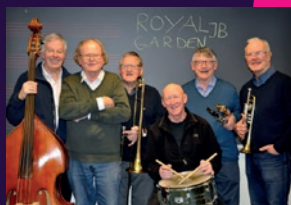
ROYAL GARDEN JAZZBAND