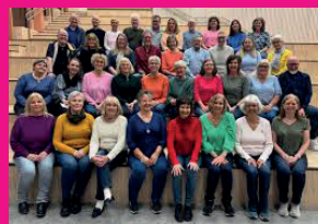
DET LOKALE KORET KOR-ONA